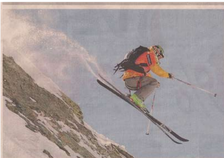
Riders sugli sci Alla gara Open di questo weekend seguirà il 24 e il 25 aprile la discesa del canalone Marinelli sulla parete Est del Rosa

EVENTO. DIVERTIMENTO, SPETTACOLO E SPORT AI PIEDI DEL ROSA