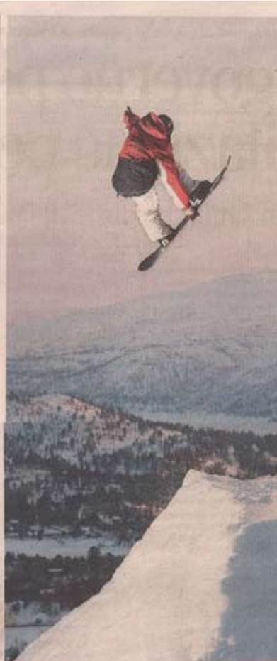
Gli operatori divisi tra paura e prudente ottimismo

va soluzione del co-marketing coordinata dalla Vinlattea. In sostanza, acquistando lo skipass, lo sciatore riceve un blocchetto di coupon che può utilizzare acquistando prodotti delle ditte coinvolte, tutte di beni di largo consumo. Il valore del coupon è pari al costo dello skipass. Quindi denaro costante. Sempre coltivando il pubbli-